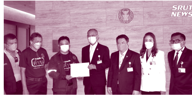
ผู้แทนราษฎร เป็นผู้รับหนังสือ ซึ่ง สร.รฟท. แสดงจุดยืนเพื่อคัดค้านร่าง พ.ร.บ. การขนส่งทางราง พ.ศ. ...