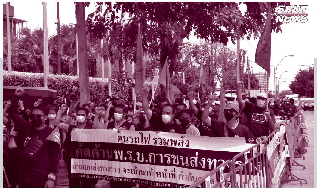
วันที่ 7 กรกฎาคม 2565 (สร.รฟท.) พร้อมสมาชิก คนรถไฟและองค์กรสมาชิกของสมาพันธ์แรงงานรัฐวิสาหกิจสัมพันธ์ ร่วมยื่นหนังสือคัดค้าน ร่าง พรบ.การขนส่งทางราง พ.ศ. ... ต่อ นายชวน หลีกภัย ประธานรัฐสภา