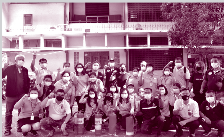
วันที่ 18 กรกฎาคม 2565 กรรมการและเจ้าหน้าที่ สร.รฟท. และ สอ.สร.รฟท. เข้าร่วมสัมมนาแผนป้องกันและระงับอัคคีภัย