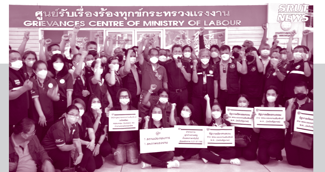
วันที่ 26 กรกฎาคม 2565 สร.รฟท.ร่วมกับสมาพันธ์แรงงานรัฐวิสาหกิจสัมพันธ์ (สรส.) และสมาพันธ์แรงงานไทย (คสรท.) ยื่นหนังสือถึงรัฐมนตรีว่าการกระทรวงแรงงาน (นายสุชาติ ชมกลิ่น) ขอคัดค้านและให้ถอนร่างพระราชบัญญัติแรงงานสัมพันธ์ในรัฐวิสาหกิจ พ.ศ. ...

บรรณาธิการ : สุพิเชษฐ สุวรรณชาติ กองบรรณาธิการ : บรรพต สังคสุข, ปิยพันธ์ ชำนาญภักดี, กชภูมิ ชนวงษ์, นายเศกสิทธิ์ นาคสัมฤทธิ์, ยศพร วรรณโร, กัมพลสร เจตนจุฑารัตน์, สุชัย โบบาง, นครชัย โยระชัยสาร, สมชาติ นาคแสนพญา, รัฐพงษ์ มิตรรัก, ปราโมทย์ โมกงงาม ที่ปรึกษา : สรวุช สราญวงศ์, สมศักดิ์ โกศัยสุข, สาวิตย์ แก้วหวาน, กมล ศิริจันทร์ พิมพ์ที่ : โรงพิมพ์ดอกเบญจ โทร. 0-2272-1169-72 โทรสาร 0-2272-1173