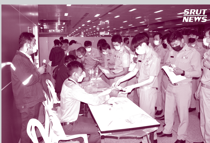
วันที่ 22 กรกฎาคม 2565 สร.รฟท.และ สอ.สร.รฟท.เปิดโต๊ะรับสมัครใหม่ นายสถานีระดับ 5 และระดับ 6 ณ สถานีกลางบางซื่อ จำนวน 300 คน