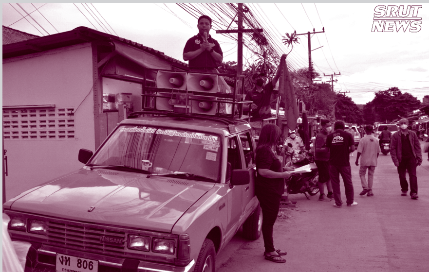
วันที่ 6 กรกฎาคม 2565 สร.รฟท. ได้ออกชี้แจง ร่าง พรบ.การขนส่งทางราง พ.ศ...มีผลกระทบต่อสมาชิกและประชาชนอย่างไร บริเวณนิคมรถไฟ กม.11